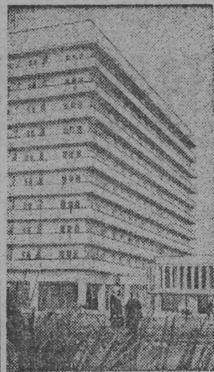
АБХАЗСКАЯ АССР. Это десятиэтажное здание — новая здравница курорта Пицунда. Дом отдыха издательства «Правда» скоро примет первых отдыхающих.