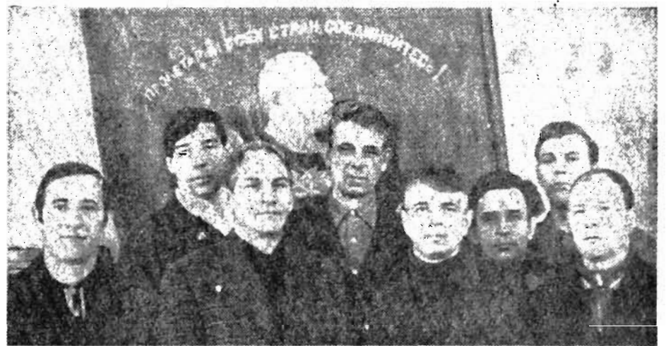
Популярным и действенным стало традиционное соревнование очистных и проходческих бригад шахты в честь дня рождения Сергея Мироновича Кирова, имя которого шахта носит. Немало резервов вскрыло это соревнование и поставило их на службу.

О делах коллектива шахты имени Кирова — флагмана нашего рудника, о путях и методах борьбы за претворение в жизнь решений XXV съезда КПСС наш рассказ.