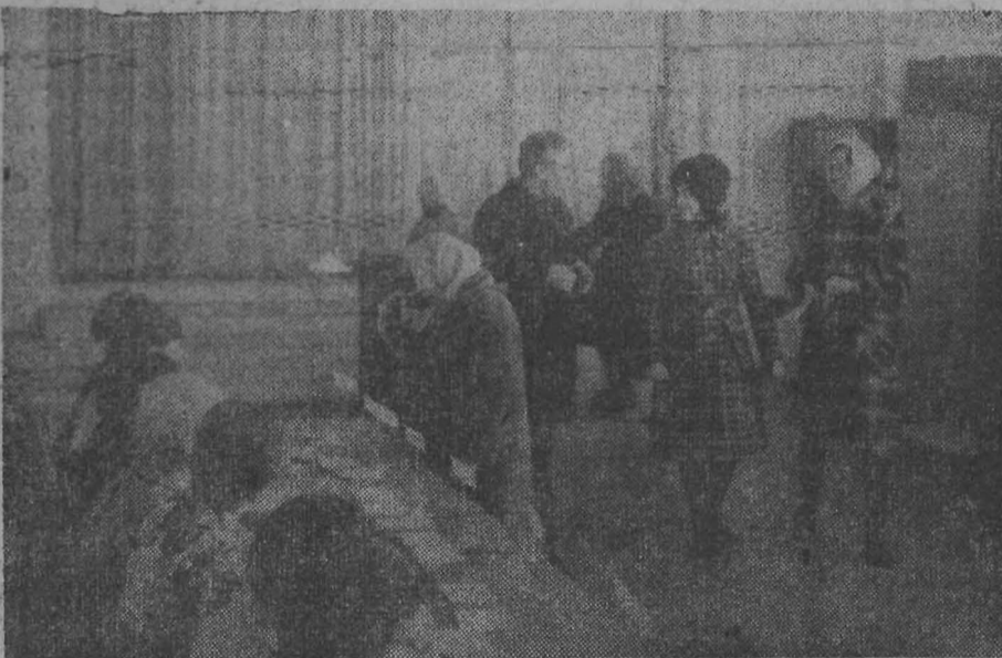
Идет голосование на избирательном участке № 25.

В этот же день в 12 избирательных округах состоялись выборы депутатов городского Совета взамен выбывших. Всем выдвинутым кандидатам в депутаты избиратели выразили полное доверие.