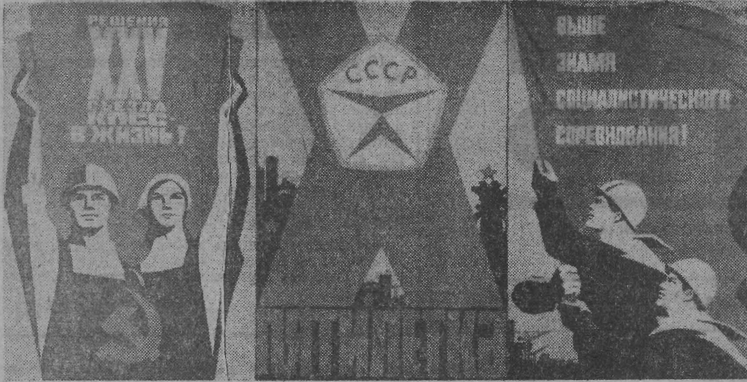
Плакат художника В. Брискина. Издательство «Плакат».