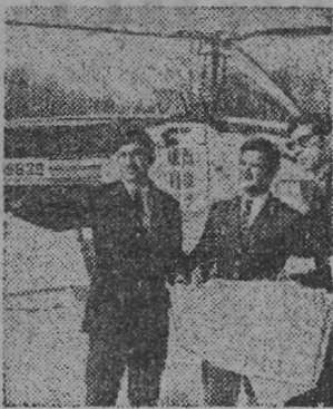
МОЛДАВСКАЯ ССР. Перелет лесных обитателей, проведенная в республике, показала значительный рост их численности. Наземный и проведен-

ный с воздуха учет показал, что в настоящее время в Молдавии обитает свыше пяти тысяч кабанов, почти тринадцать тысяч косуль.