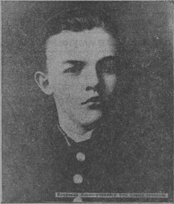
Владимир Ильич Ленин.

Как-то я был свидетелем такого эпизода. Житель Кемеровской области В. А. Харитонов после осмотра ленинского музея в Ульяновске выразил удовлетворение, каким цветущим стал край Ильича. Он отметил, что и у них, на берегах Томи, происходят разительные перемены.