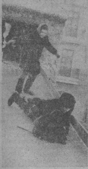
На горке весело!

— И конкурс на лучшего снеговика — хотим свой парк украсить. И соревнования по лыжам. И занятия кружков «Спортивные игры», «Юный хоккеист», «Юный затейник». И конкурсы, и встречи.