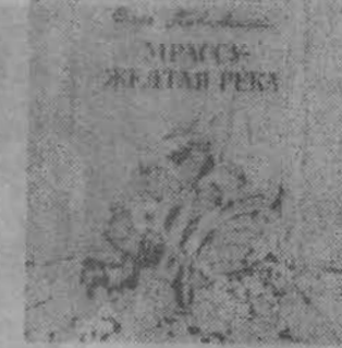
Читатели встретятся с переизданными произведениями советских и зарубежных авторов.

К 60-летию Октября издательство готовит выход большой публицистической книги «Рабочие плечи Кузбасса». В работе над ней участвовали прозаики, поэты, ведущие журналисты области.