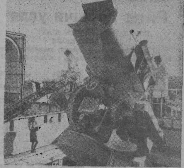
Таджикская ССР. Гиссарская астрономическая обсерватория Института астрофизики АН Таджикской ССР — крупнейшая в Средней Азии. На снимке: научные сотрудники обсерватории готовят к наблюдению высокоточную установку (ВАУ).