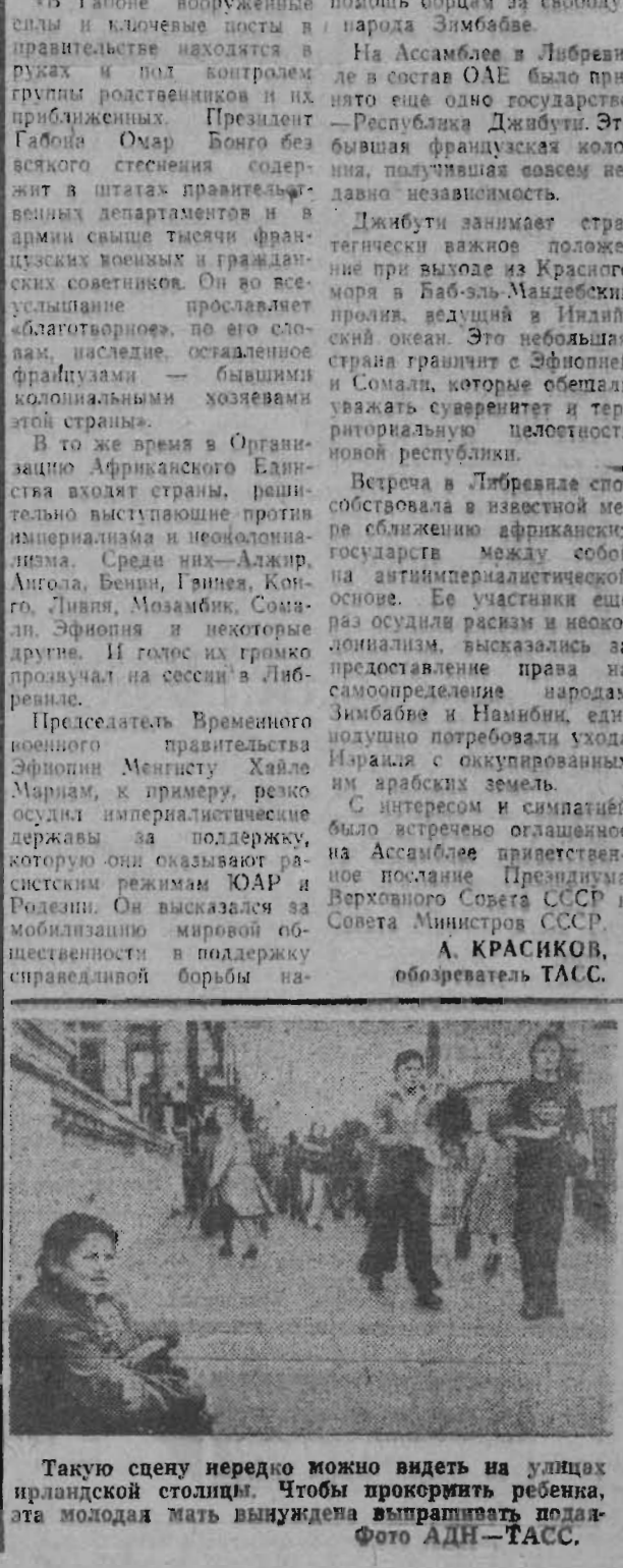
Такою сцену нередко можно видеть на улицах прландской столицы. Чтобы прокормить ребенка, эта молодая мать вынуждена выпрашивать подаяние.

сыр и пошлв к дыре. Первым вылез «Осел», принял мешки и помог «Зинке» выбраться. Вдруг с двух сторон их осветили яркие лучи фонариков и раздалась команда: «Руки вверх!» Зайдя в кабинет следователя, не дожидаясь вопросов, «Осел» сам обратился: — Гражданин следователь! Я отвечаю на все ваши вопросы, скажу всю правду, но прежде разрешите всего два вопроса? — Пожалуйста, — разрешил капитан. — Как я засыпался? — Очень просто. Вы сами к себе вызвали милицию. О вашем проникновении в магазин нас известила сигнализация. Что еще? — Если это не вранье — второй вопрос: еще кто-нибудь попадался на этих проклятых сигналах? — И не один десяток, — спокойно ответил следователь и продолжал: — Возможно, вы еще встретитесь где-либо на пересылке или в колонии с некими Ермаковым, Соколовым, Винокуровым, Мясниковым, Бурнаковым. Все они задержаны прямо в магазине. «Осел» задумался. Потом попросил бумагу, ручку и очень подробно стал описывать историю своих ночных походов, конечно, всю вину сваливая на «Зинку». «Зинка» же в свою очередь полностью очернил «Осла». Но это их, конечно, не спасло. Они понесли заслуженное наказание. Таков финал всех, кто не жаждет честно трудиться и пытается жить за счет общества. И. СОТНИКОВ, майор милиции.