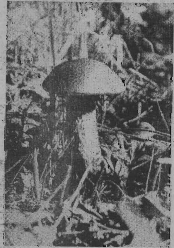
ПОСЛЕ ДОЖДИЧКА...