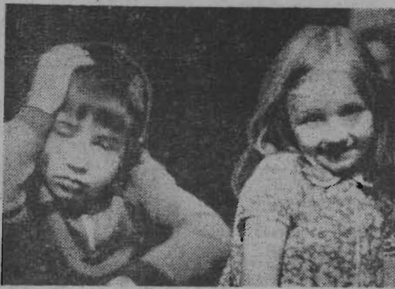
ДВА ХАРАКТЕРА.