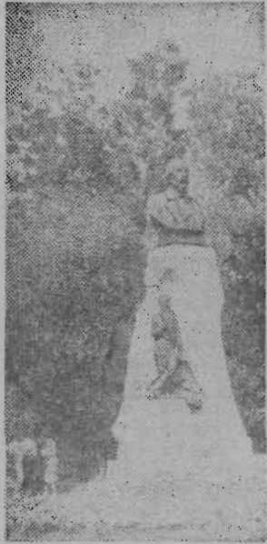
Памятник И. Н. Ульянову.

Совет музея школы собирает материал и проводит большую исследовательскую работу по истории гимназии. Учащиеся дорожат званием ученика Ленинской школы. Их девиз: «Жить, учиться и работать по-ленински».