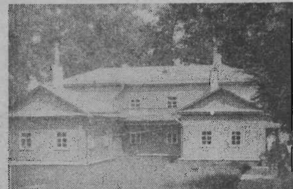
Дом-музей В. И. Ленина. Вид со двора.

Неповторимо и оригинально сооружение Мемориала.