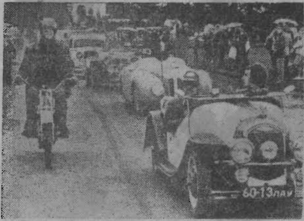
Интерес жителей и гостей эстонского города Пярну недавно был прикован к событиям, проходившим на стадионе «Калев» и его окрестностях.

Из Москвы и Таллина, Тарту и Риги, Вильнюса и других городов сюда съехались почти полторы сотни старинных автомобилей, мотоциклов и велосипедов.