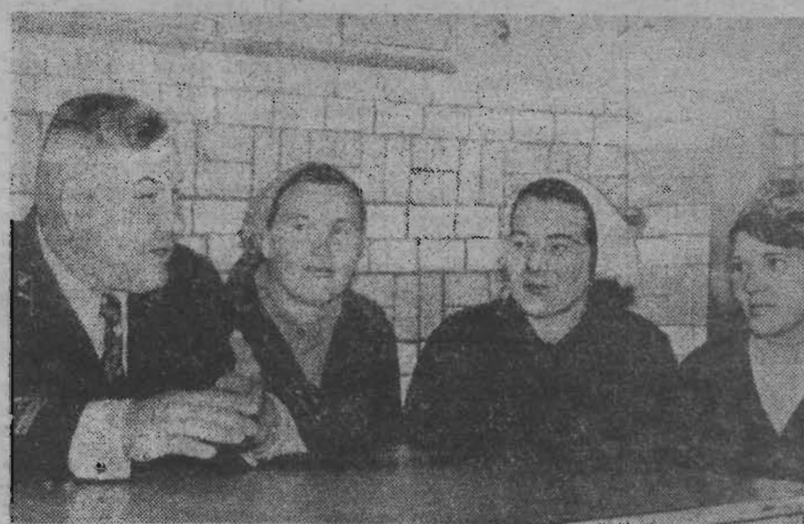
С большим воодушевлением восприняли работники ПТО вагонов станции Ленинск-Кузнецкий-II проект Основного Закона нашего государства. В рабочих коллективах проходит обсуждение этого важного документа.