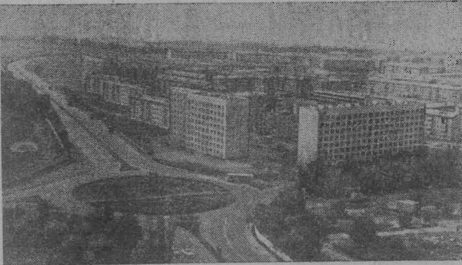
Столица Казахской ССР — Алма-Ата. Новый микрорайон «Орбита». Фотохроника ТАСС.

В библиотеке Дома учителя организована выставка «Начинаю про Ленина рассказ», посвященная 60-летию Великого Октября. В специальную папку подобрана вся методическая литература для учителей по изучению ленинского наследия. 56 педагогов школ города уже побывали на выставке.