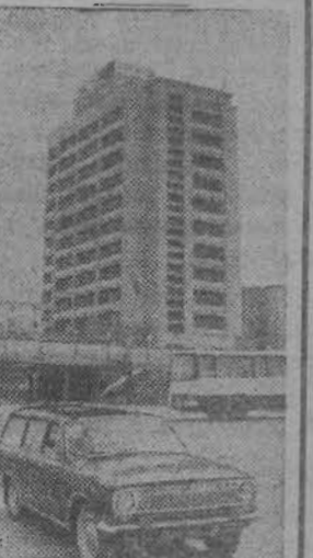
Украинская ССР. Днепропетровский. Новая гостиница «Заря».

ЗАПОРОЖЬЕ. Досрочно закончено изготовление трансформатора для Нурекской ГЭС. Его мощность 400 тысяч киловольт-ампер.