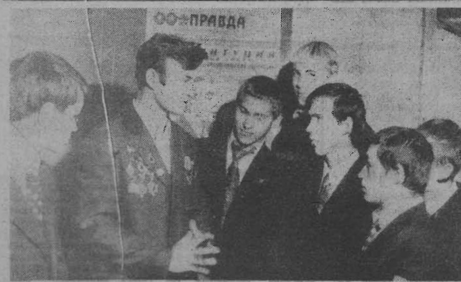
Учебный год в училище № 38 по традиции начался с Ленинского урока «Время с Октября берет отчет».

ЕРЕВАН. Ключевая вода забита из скважины Назреванского месторождения, выявленного геологами в 20 километрах от Еревана. Разведанное ими ранее Памбакское месторождение значительно улучшит водоснабжение Кировакана — города химиков и станкостроителей. В небогатой реке и озерах Армении проблема воды особенно актуальна и решается путем рационального использования имеющихся ресурсов. За последние годы они пополняются за счет подземных артезианских колодезей. Тысячи скважин пробурено в Араратской долине, в недрах которой обнаружено огромное море пресной воды. (ТАСС).