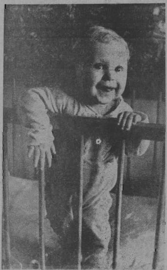
ПОДНЯЛАСЬ САМА.

Шли к автобусной остановке: дождьные своей нищей. Не зря совершили поездку. П. ЯГУНОВ.