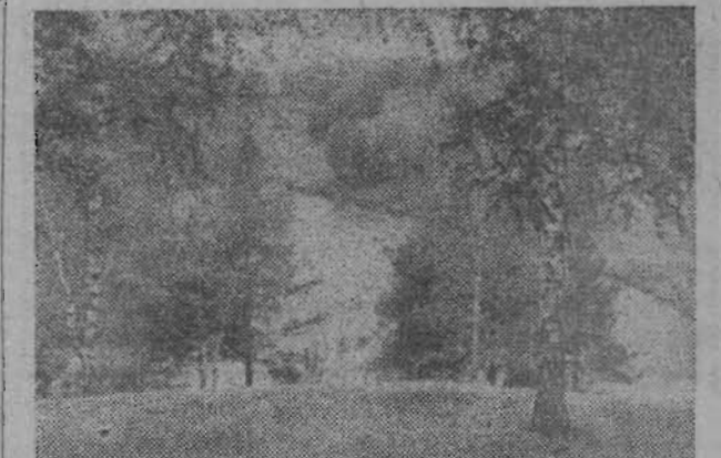
В КРАЮ РОДНОМ.