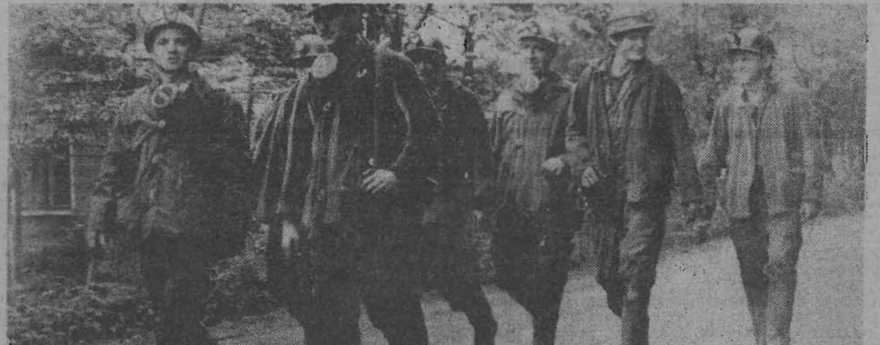
Коллектив подготовительного участка № 4 шахты «Октябрьская» с первых дней 1977 года работает с опережением производственного графика. Еще в мае участок выполнил свои социалистические обязательства, взятые в честь 60-летия Великого Октября.

Особенно хорошие результаты в труде на этом