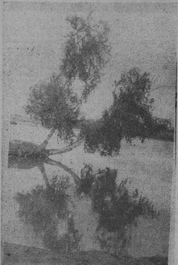
ЕЩЕ НЕ СВРОШЕН ЗОЛОТОЙ НАРЯД...