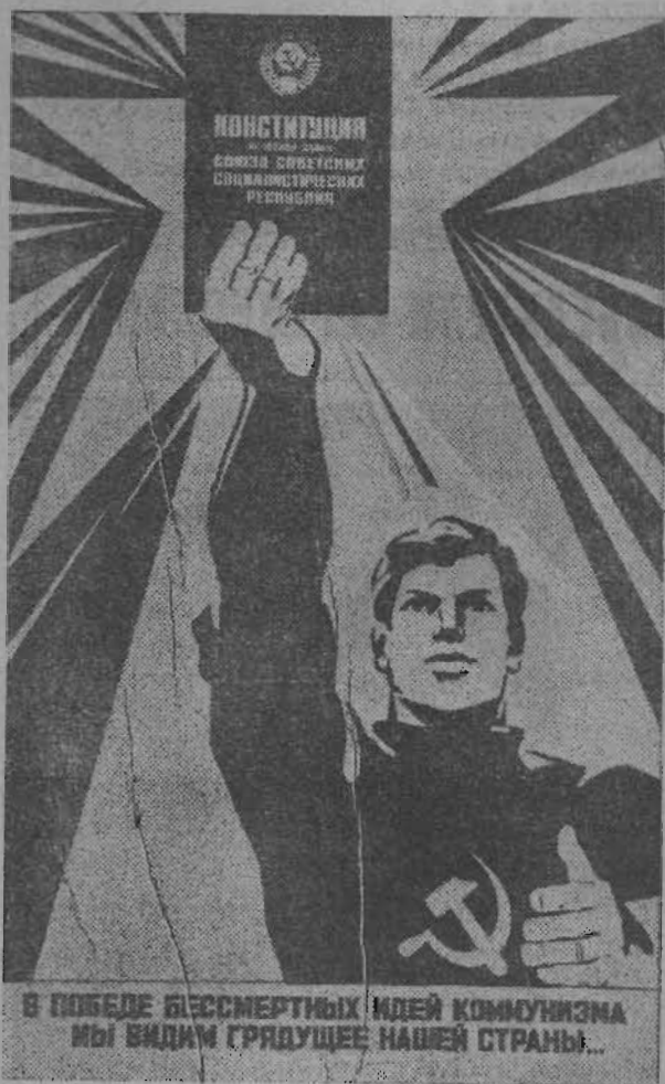
В ПОБЕДЕ БЕССМЕРТНЫХ ИДЕЙ КОМУНИЗМА МЫ ВИДИМ ГРЯДУЩЕЕ НАШЕЙ СТРАНЫ...