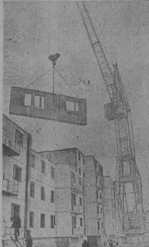
На снимках: бригада получает поздравления; идет монтаж дома улучшенной серии.