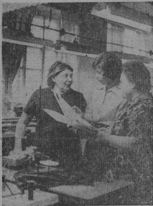
На снимках: новая линия; работники объединения «Одежда», активно участвующие во внедрении потока (слева направо): мастер процесса