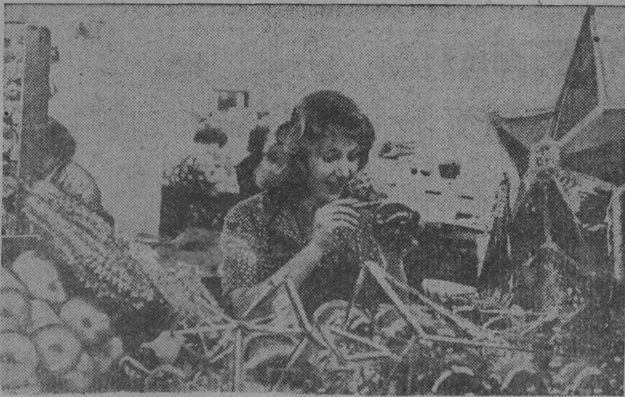
Новый год не за горами. Об этом скоро вспомнят москвичи и ленинградцы, жители всех городов, поселков, деревень Советского Союза. Но есть в Москве такой завод, где об этом веселом празднике помнят круглый год. Его хрупкая блестящая продукция украшает новогодние елки в Кремле, Домах культуры, на площадях, улицах, в парках, в каждом до-