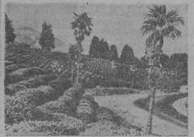
В Чаквском совхозе имени В. И. Ленина Кобулетского района Аджарской АССР зеленеют чайные кусты, чаеводы ведут обработку плантаций.