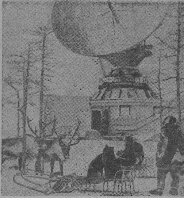
Поселок Билибино (Чукотский национальный округ). На снимке: телевизионная станция «Орбита» за Полярным кругом.