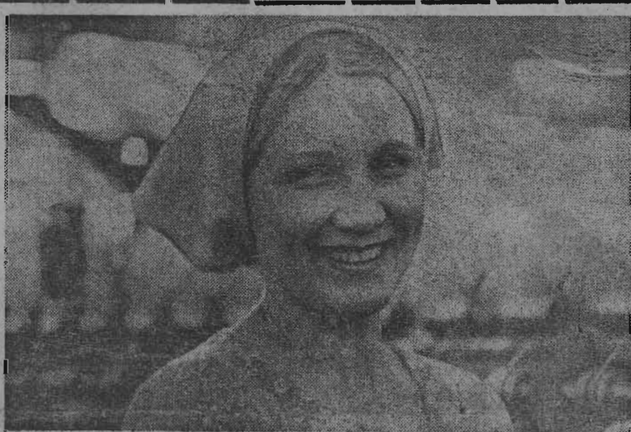
Идет ударная молодежная вахта