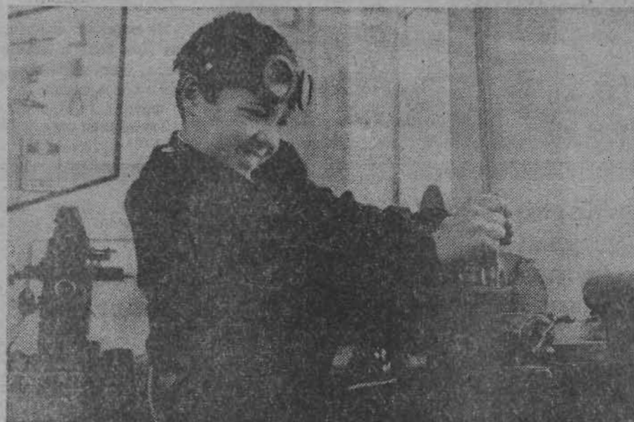
НА УРОКЕ ТРУДА.