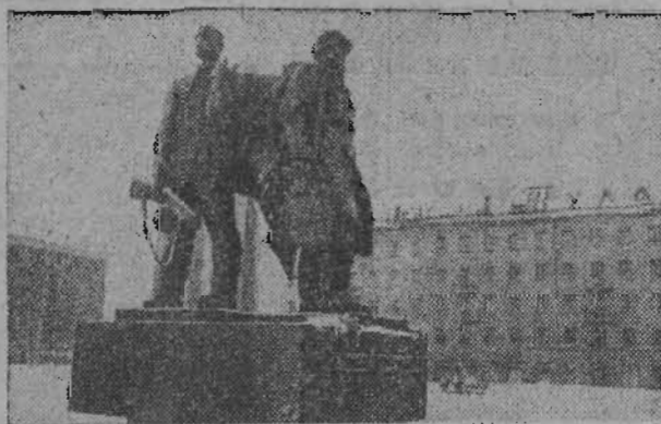
С каждым годом хорошеет город-герой Тула. В новых микрорайонах растут многоквартирные дома, торговые центры, детские сады и школы.