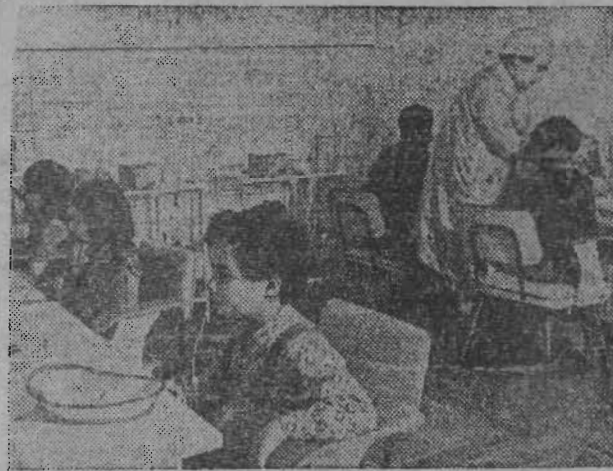
Лечебный и методологический центр по организации стоматологической помощи детям открылся в Бресте.

Маленькие пациенты, приходящие в поликлинику, неожиданно для себя оказываются в окружении интересных и занятых вещей: здесь и чучела маленьких зверьков, и киндерки в клетках, и разноцветные рыбки в аквариумах, и изображения многих знакомых персонажей из мультипликационных фильмов. Все это снимает у детей страх при появлении врача, создает предпосылки для успешного лечения.