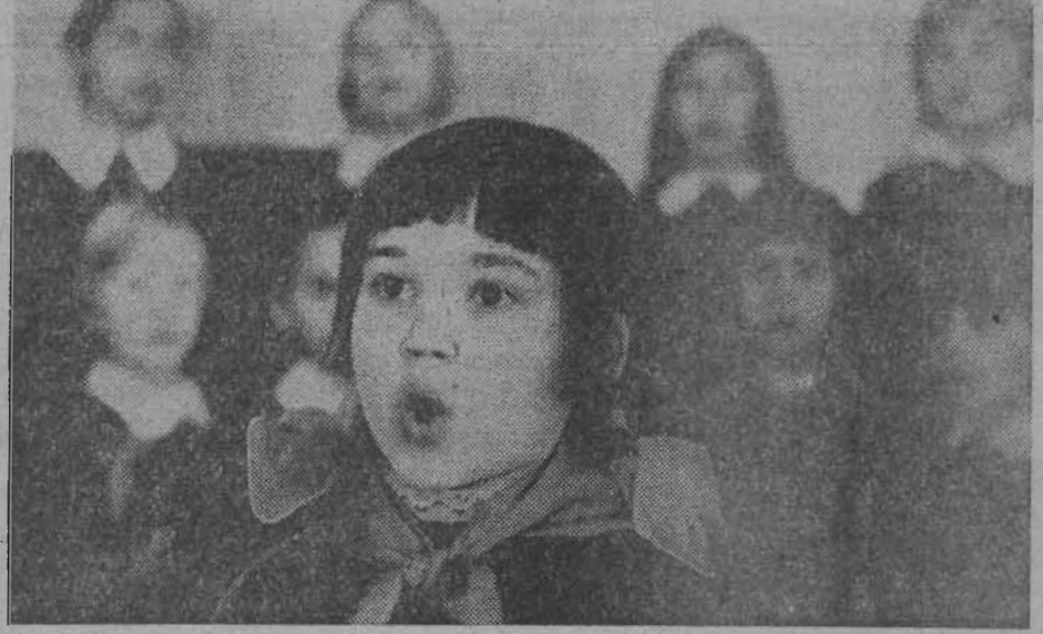
СОЛИСТКА ШКОЛЬНОГО ХОРА.