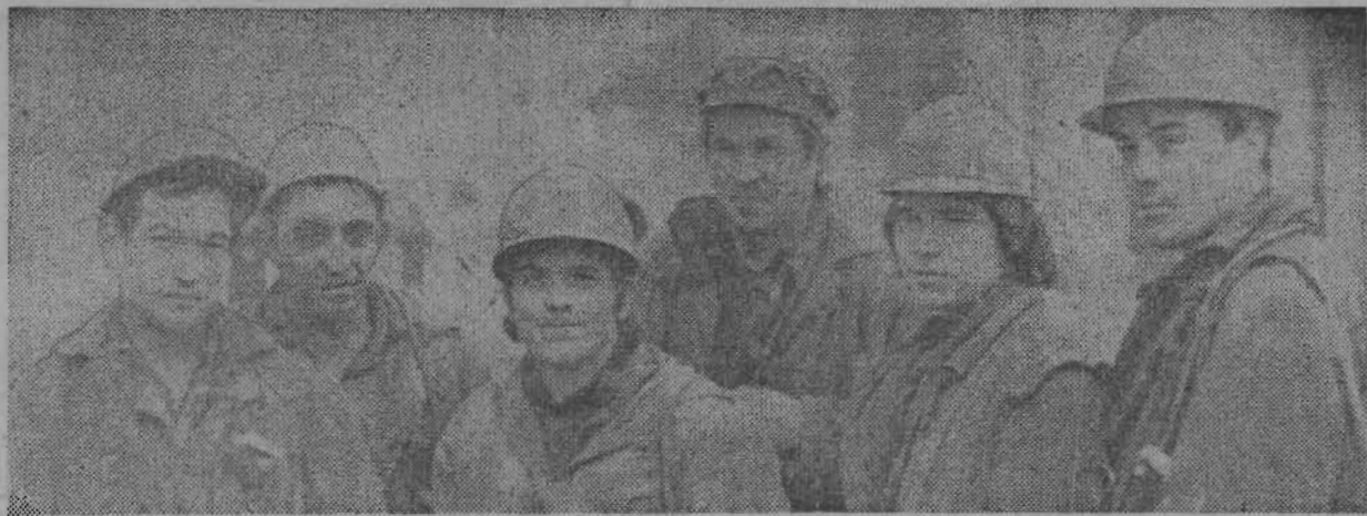
ВЕСТИ С ШАХТЫ «КОМСОМОЛЕЦ»