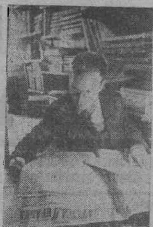
последнего оплота Вре...