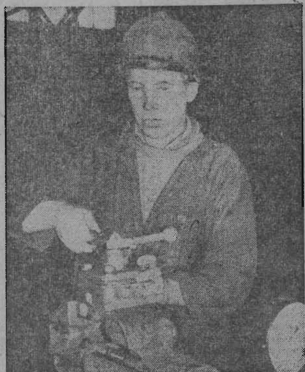
Оснащение шахт рудника высокомеханизированным комплексным оборудованием требует более квалифицированного обслуживания.

строительстве 56-квартирного дома в Соцгороде и на одном из важнейших объектов — заводе ЖБК № 2. Намечено освоить 12 тысяч рублей, что превышает суточный план Ленинского ЦСУ № 2. В. ЕФИМОВ.