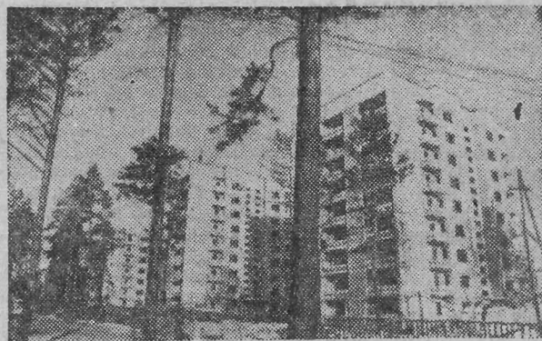
На снимке: Саянск строится.