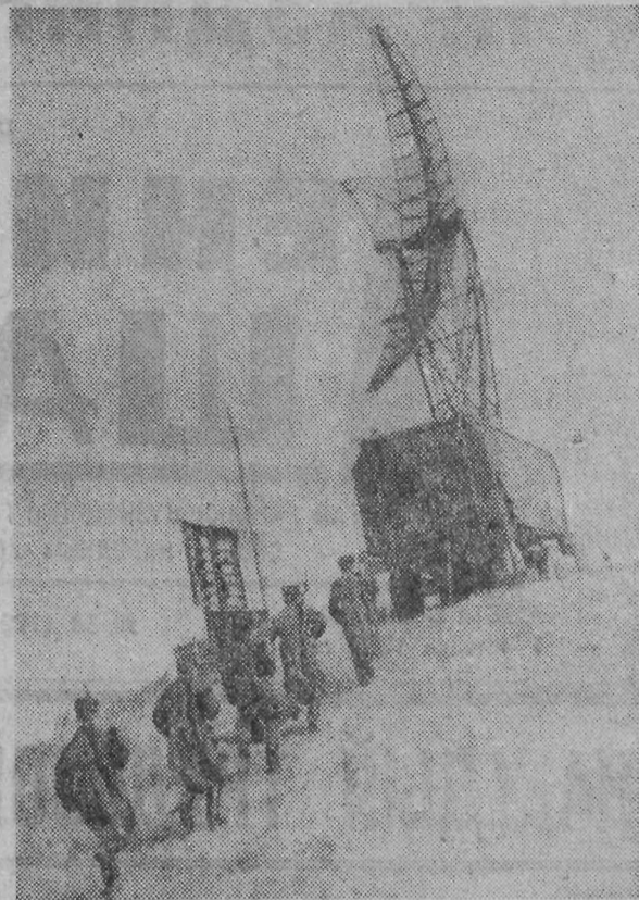
Воины одного из подразделений Краснознаменного Сибирского военного округа достойно продолжают славные боевые традиции отцов и дедов. Современная военная техника, мастерство воинов, крепкая дисциплина — вот слагаемые высокой боевой готовности.