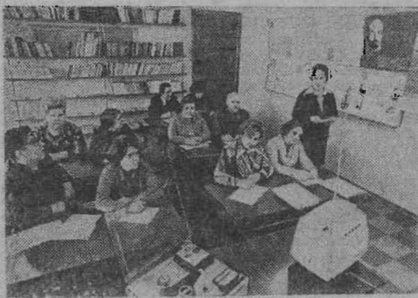
В ОБОИПЛО В Г Р А Д СКАЯ область. Большой опыт в организации политического просвещения и экономического образования трудящихся накоплен партийной организацией Ленинградского неф-

теперерабатывающего завода. На предприятии действует 34 кружка и семинара системы партийного, комсомольского и политического образования, а также школы коммунистического труда.