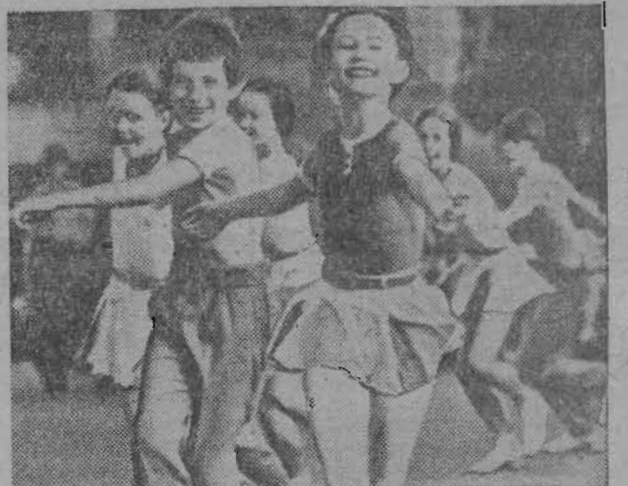
«Солнечный круг». Фото Андрея Поповичева, участника выставки работ юных фотолюбителей, открытой в Московском городском Дворце пионеров и школьников на Ленинских горах.