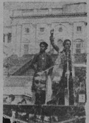
выступление лидера «Университетской десяти» Бенджамин Чейвис.

На снимках: во время массового митинга протеста в Вашингтоне против политики правительства — это самое крупное выступление американцев со времени вьетнамской войны;