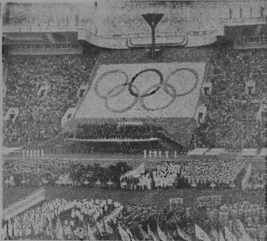
Москва. Большая спортивная арена Центрального стадиона имени В. И. Ленина. Горит огонь Олимпиады-80!

Продолжались предварительные состязания по баскетболу, боксу, классической борьбе, волейболу, хоккею на траве, академической гребле и другим видам спорта. Прошли очередные матчи футболистов. Завершена обязательная программа по гимнастике в командном первенстве среди женщин.