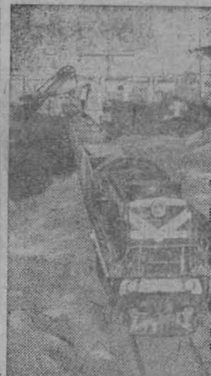
БЕЛГОРОДСКАЯ ОБЛАСТЬ. На ударную вахту в честь XXVI съезда КПСС встали горняки Стойленского горно-обогатительного комбината. Коллектив ГОКа обязался выполнить задание пятилетки досрочно, к 15 декабря. На снимке: отгрузка сверхплановой руды.