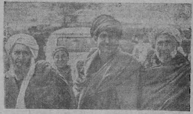
Афганистан. Трудящиеся полям горячо приветствуют прогрессивные преобразования в стране, и в первую очередь на селе.

Народное правительство объявило о повышении закупочных цен на некоторые виды сельскохозяйственной продукции, на льготных условиях предоставляет крестьянам удобрения, высокоурожайные сорта семян зерновых, технику.