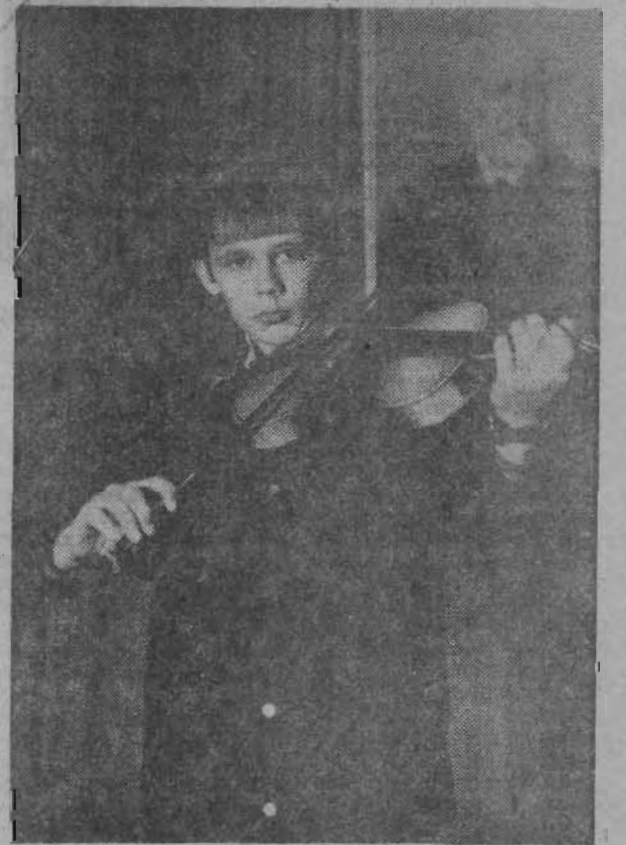
На фотоконкурсе «Ленинского шахтера». ЮНЫЙ МУЗЫКАНТ.

НЕПРИВЫЧНАЯ тишина встречает нас в летние каникулы в стенах школы № 38. Большинство ребят отдыхает в пионерских лагерях, работает в лагере труда и отдыха. Те кто остался в городе, приходят в школу. Двух таких девочек мы и встретили в одном из классов. Девочки бережно пересаживали цветы. Мы попробовали рассказать их о том, как у них прошли летние каникулы.