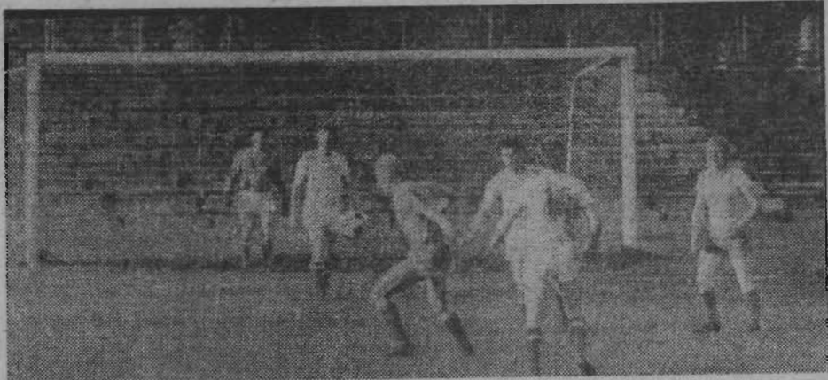
На снимке: момент встречи между командами «Мотор» и шахты «Кузнецкая».

«Комсомолец». Они лидируют в соревнованиях с 20 очками, но у них проведены все игры. Второй претендент на высшее место в турнирной таблице — команда шахты «Кузнецкая». В своём активе она имеет 19 очков, но в запасе ещё одна игра с командой шахты «Октябрьская». В случае победы кузнецчане становятся чемпионами. Ничья оставляет вопрос за первое место неразрешённым.