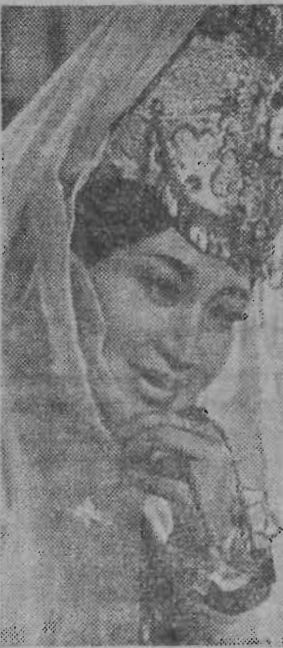
Советский Казахстан — социалистическая республика, одна из пятнадцати среди равных в созвездии братских республик Страны Советов.

Путь, пройденный казахским народом за 60 лет, — яркое доказательство торжества ленинской национальной политики. В течение жизни всего лишь одного поколения отсталая в прошлом национальная окраина царской России стала развитой социалистической республикой. Казахи с помощью русского и других братских народов нашей страны преобразуют природу, оживляют пустыни, возводят круп-