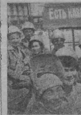
ЦИФРЫ И ФАКТЫ

Путь, пройденный казахским народом за 60 лет, — яркое доказательство торжества ленинской национальной политики. В течение жизни всего лишь одного поколения отсталая в прошлом национальная окраина царской России стала развитой социалистической республикой. Казахи с помощью русского и других братских народов нашей страны преобразуют природу, оживляют пустыни, возводят круп-