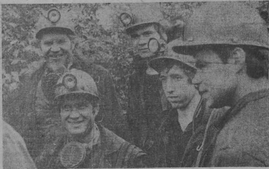
Коллектив очистного участка № 7 шахтоуправления «Кольчугинское» за семь месяцев этого года добыл 281,4 тысячи тонн угля. На сверхплановый счет горняки записали около 43 тысяч тонн топлива. Это хороший подарок коллектива Дню шахтера. На снимке: горняки очистного участка № 7 перед спуском в шахту.

На заводе «Красный Октябрь» с каждым днем нарастает ритм соревнования, посвященного Дню шахтера. Трудовой накал товарищеского соперничества особенно остро чувствуется сейчас, в последние предпраздничные дни.