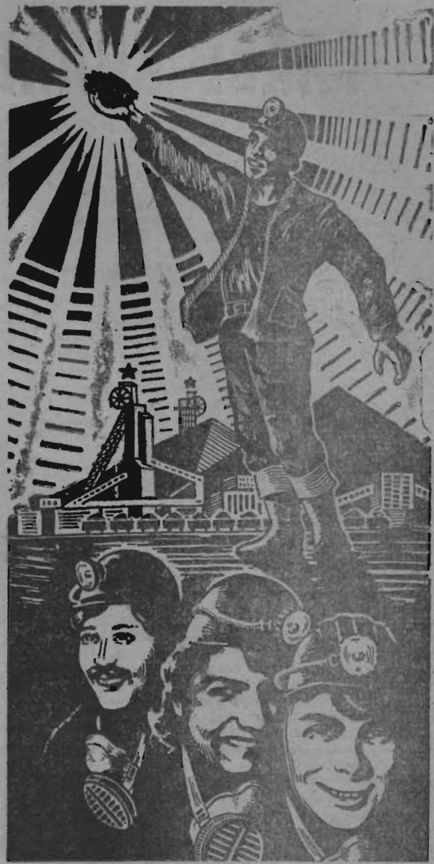
Плакат Ю. Панова.