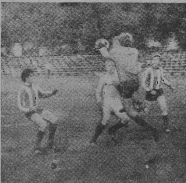
На снимках: команда-победительница; момент одного из матчей.