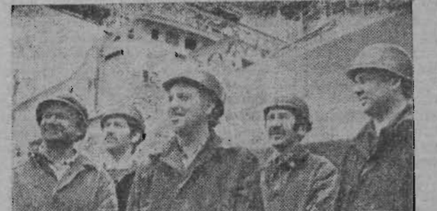
Корабелы киевского ордена Ленина завода «Ленинская кузница» соревнуются на достойную встречу XXVI съезда КПСС. К открытию партийного форума решено сдать досрочно два траулера с государственным знаком качества.