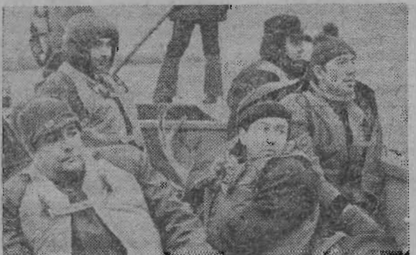
На трассе Северного морского пути работает Экономическая экспедиция Сибирского отделения Академии наук СССР.