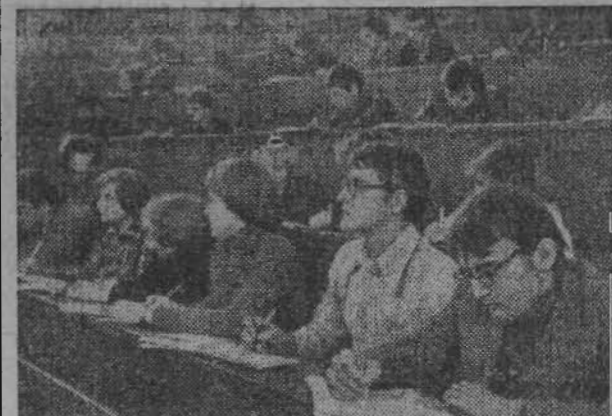
На нижнем снимке: лекция на механико-математическом факультете МГУ.

На верхнем этаже — здание Московского государственного университета имени М. В. Ломоносова на Ленинских горах.