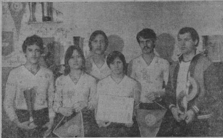
На снимке: команда-победительница.