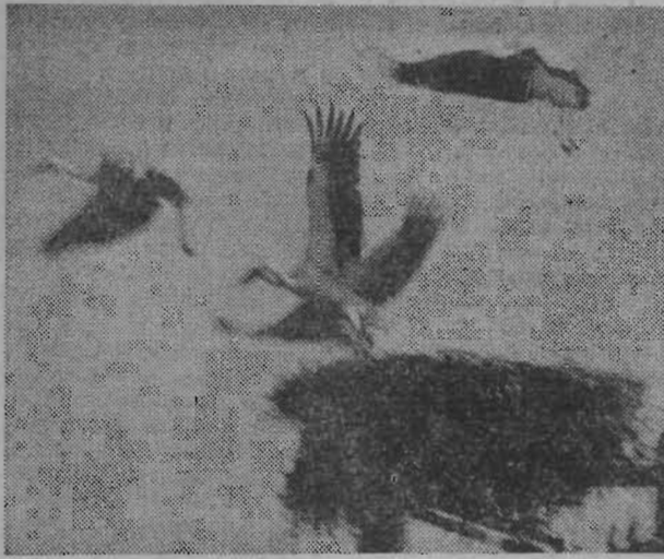
На фотоконкурс ПЕРЕД ДАЛЬНЕЙ ДОРОГОЙ. «Ленинского шахтера».