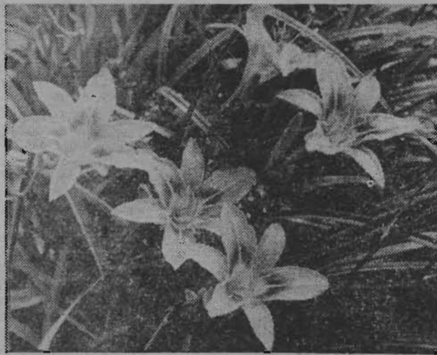
ОТЗВУКИ ЛЕТА.