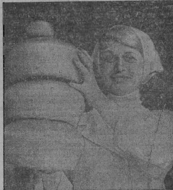
ИЗ МУКИ НОВОГО УРОЖАЯ.