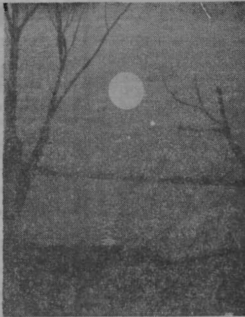
На фотоконкурс «Ленинского шахтера». ПОДРУЖИЛИСЬ. ПОЛНОЛУНИЕ. В ЭЛЕКТРИЧКЕ. Фото Э. Кострмина, А. Лазарева, В. Кириллова.